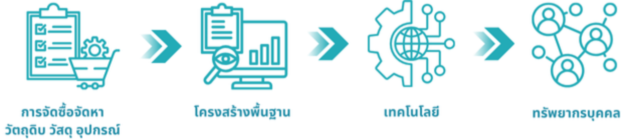
กิจกรรมสนับสนุน

การวิเคราะห์ผู้มีส่วนได้เสียในห่วงโซ่คุณค่าของธุรกิจ