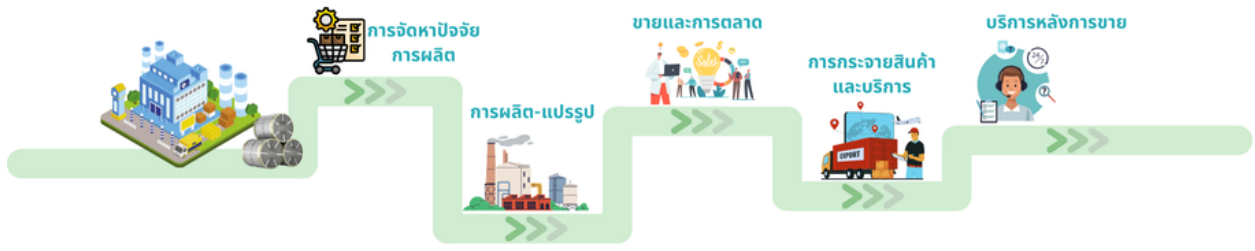
กิจกรรมหลัก